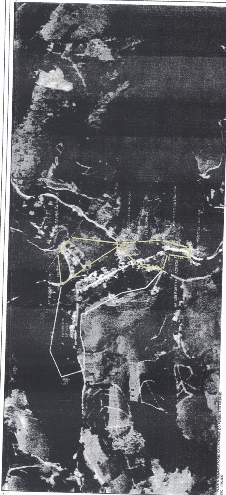
1- PLANTA DEMARCAÇÃO DA EXPANSÃO DO PERÍMETRO URBANO ESC. 1/10.000